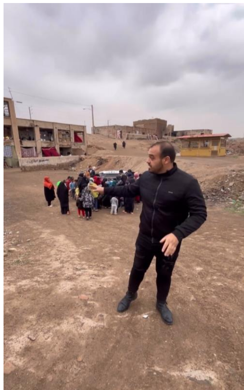
تصویر ۱. حضور نمونه پژوهش در منطقه کم‌برخوردار