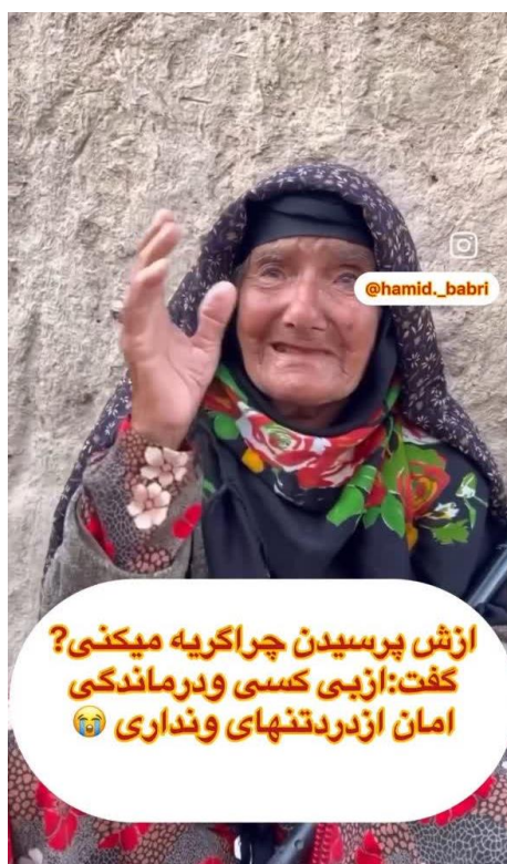
تصویر ۳. بازنمایی شرایط دشوار معیشتی پیرزن کم‌برخوردار