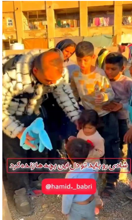
تصویر ۲. اهدای عروسک به کودکان مناطق کم‌برخوردار

اخلاقی همچون انسان مهربان، دغدغه‌مند و نیکوکار می‌شوند.