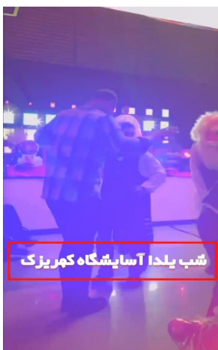
تصویر ۵. حضور و رقص در آسایشگاه کهریزک