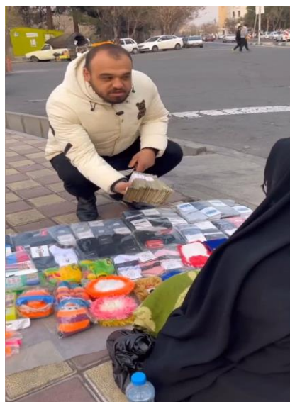
تصویر ۴. اهدای پول نقد به زن دست‌فروش

اولین خرده‌مضمون «نیکوکاری مادی» است. کمک‌های مادی حمید ببری در چهار گونه قرار گرفته‌اند. گونه اول کمک‌های پولی اوست. همان‌طور که پیش‌تر نیز اشاره شد، حمید ببری با حضور در کنار نیازمندان گوناگون مبالغی جالب توجه از پول نقد را به شخص نیازمند اهدا می‌کند. او مدعی است این مبالغ با کمک‌های مردمی جمع‌آوری شده و اکنون به انسان نیازمند اهدا شده‌اند. این شکل از کمک مالی بیش از آنکه دارای اهداف نیکوکارانه باشد، جنبه نمایشی دارد. ببری سعی داشته است مبلغ اهدایی را با دسته‌های پول جالب توجه و زیاد انتقال دهد تا توجه بیشتری را به خود جلب کند و در اذهان کاربران، حجم زیاد مشارکت مردمی و زیاد بودن مبلغ را تبادر کند. همچنین، احتمال می‌رود این شکل از کمک به صورت موردی و فقط یک مرتبه انجام شود. این شکل از کمک‌ها قابلیت حل مشکلات و نیازمندی فقرا را به طور کامل ندارد و فقط کاربران بیشتری را با خود همراه می‌کند. همان‌طور که در تصویر ۴ نیز قابل مشاهده است، حمید ببری در یکی از چهارراه‌های شهری حضور داشته و در دستان خود شش دسته پول ده‌هزارتومانی داشته که برای اهدا به زن دست‌فروش در ایام نزدیک به عید به منظور برطرف کردن یکی از مشکلات خانواده بوده است. سپس مبلغ اهدایی را به سمت زن دست‌فروش کنار چهارراه برده و بدون آنکه چهره زن را نشان دهد، با او گفت‌وگو کرده و ببری بیان کرده است این پول عیدی مردم است و مردم را دعا کنید. شیوه نمایش پول و نمونه پژوهش حاکی از آن است که او به مثابه یک ناجی است که زن دست‌فروش را از شرایط دشوار اقتصادی تا حدودی دور کرده است. همچنین، احتمال می‌رود این شکل از کمک مالی صرفاً یک مرتبه و موردی باشد و پس از پایان مصرف این پول، شرایط معیشتی زن دست‌فروش مانند گذشته می‌شود.