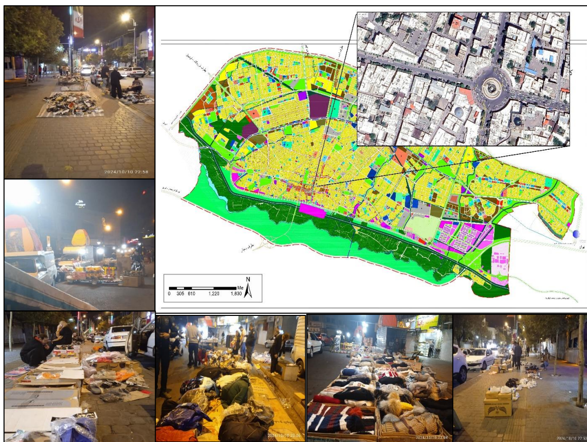
شکل ۲- موقعیت جغرافیایی محدوده تحت مطالعه و تصاویر خرده‌فروشان شبانه

مصاحبه‌شوندگان)، فرایند مصاحبه با استفاده از فیش‌برداری و یادداشت‌برداری انجام شد. سپس، داده‌ها در بستر مدل زمینه‌گرا اجرا شدند؛ طوری که ابتدا داده‌ها کدگذاری باز شدند، سپس با به‌اشتراک‌گذاری کدها، کدگذاری محوری انجام شد و در نهایت، با کدگذاری انتخابی، مقوله‌ها و مفاهیم اصلی استخراج شدند. در ادامه چنین فرایندی، مدل پارادایمی حاصل از شرایط علی، زمینه‌ای، مداخله‌گر، راهبردی و در نهایت پیامدی ترسیم و تبیین می‌شود. روایی (تأییدپذیری) با استفاده از روش فن ممیزی انجام شده است که در آن، مراحل کار توسط دو نفر متخصص و آشنا به فرایند تحلیل‌های کیفی داده‌بنیاد تأیید شدند. محورهای اصلی مصاحبه در برگرفته پرسش‌های زمان شروع و اتمام فعالیت، علت انتخاب مکانی، مقدار و نحوه فروش، مبدأ تولید کالا، نحوه تهیه کالا، کیفیت کالا، کیفیت محیطی خیابان، عوامل حضور و خرید، قیمت کالاها، تمایل خریداران و شهروندان، قشربندی خریدار، امنیت و ایمنی فضا، نحوه نظارت و مدیریت شهری هستند. واحد جغرافیایی تحت مطالعه در برگرفته میدان انقلاب و پیاده‌راه امام خمینی است که محل تمرکز فعالیتی خرده‌فروشان شب‌بازار با زمان فعالیتی ساعت ۲۱ الی ۲۴ است (شکل ۲). بر این اساس، با توجه به مطالب