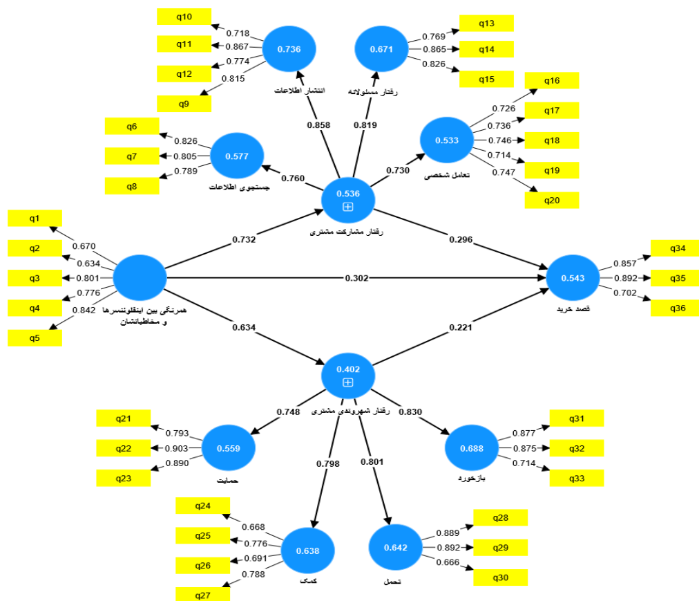
شکل ۲: خروجی مدل ضرایب مسیر