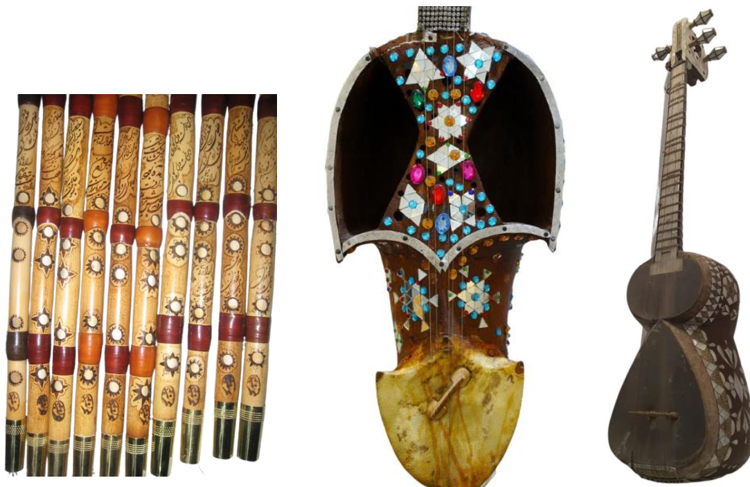
سوخته‌کاری بر ساز نی

در هنرهای تجسمی ایرانی به کارگیری نقش‌های گوناگون جمادات و نباتات و حیوانات و دیگر عناصر طبیعی بر ظروف، صفحات، مسکوکات، منسوجات و چیزهایی دیگر امری رایج بوده و دامنه آن تا عصر حاضر نیز کشیده شده است. این جلوه هنری به منطقه‌ای خاص وابسته نیست و هر ناحیه متناسب با شرایط اقلیمی و فرهنگی‌اش نقشی در کار آورده است. هر نگاره‌ای، افزون بر کارکرد زیبایی‌سازانه خود، ممکن است نمودی نمادین هم داشته باشد و از این رو چهره اساطیری شیر حاکی از نیروی خورشید و نماد پادشاهی (جایز، ۱۳۷۰، ص. ۷۶) یا نقش آهو و قوچ در فرهنگ ایرانی نمادی از فره (آموزگار، ۱۳۷۴، ص. ۳۵) است. نقوش عددی که با عناصر اسطوره‌ای در هم آمیخته‌اند، چیزی بیش از آن دارند که می‌انگاریم (یونگ، ۱۳۹۳، ص. ۴۸) و معنایی افزون بر نظام شمارش عرضه می‌کنند. دامنه نقوش نمادین و عرصه‌ای که بر آن به کار می‌رفتند، گسترده‌بو. سازهای موسیقی ایرانی، که در موسیقی شهری و به‌ویژه نواحی ایران به کار می‌رفتند، در بردارنده آرایه‌هایی گوناگون بودند. این آرایه‌ها به اندازه و جنس ساز محدود نمی‌شد و ممکن بود هر بستری با هر جنس زمینه‌ای در این حوزه به کار گرفته شود، چه سوخته‌کاری بر چوب نی باشد و چه آینه‌کاری بر رباب.