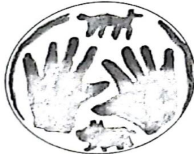
دایره - کرمان، رفسنجان

حدود سدهٔ دهم هجری قمری - عهد شاه طهماسب اول - با قلمروی نهمواره یکسان در صفحات ارس کنار حکمرانی می‌کردند (رحمتی، ۱۳۹۸، ص. ۵۵-۵۶)، اطلاعی دقیق نداریم، خاقانی شروانی که در عصر پادشاهی منوچهر و اخستان شاعر دربار این دودمان بود، در اشعارش جلوه‌ای پربسامد و یگانه از ساز دف نمودار می‌کند که احتمالاً صورتی از هنر آن منطقه یا دست‌کم دربار شروان‌شاهان باشد. او بارها در تصویرگری ساز دف به نقش دد و دام و ترکیبشان بر بستر این ساز اشاره می‌کند که نمودی ویژه و منحصر به فرد است. این شیوهٔ تزئینی در اشارات تاریخی و شعر شاعران پارسی‌گوی دیگر دیده نمی‌شود؛ اما شبیه به آنچه خاقانی می‌گوید امروزه بر ساز «دایره»ی کرمان که سازی همانند دف است، وجود دارد.