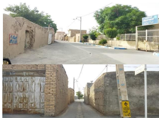
روستای کلیسان (معماری بومی و نوین)

شکل ۲: تصاویری از طراحی، معماری بومی و نوین در روستاهای مطالعه‌شده