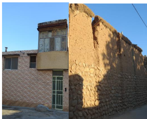
روستای حوض ماهی (معماری بومی و نوین)