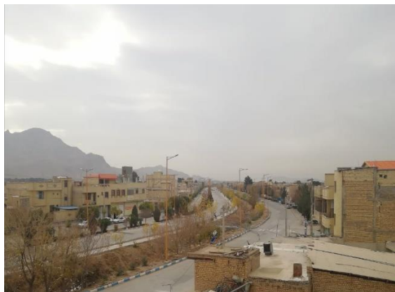
روستای باغملک (معماری و بافت نوین)

معماری و ساخت خانه‌های جدید روستایی که امروزه به‌طور تقریبی، تمامی بافت روستاهای دشتی و درصد فراوانی از روستاهای کوهستانی را شامل می‌شود، تحت‌تأثیر سیاست‌های دولتی (تسهیلات/ مقاوم‌سازی و نوسازی)، اقدام‌های جهاد سازندگی سابق، بنیاد مسکن انقلاب اسلامی و در سال‌های اخیر نیز تحت‌تأثیر اجرای طرح هادی روستایی با دهیاری‌ها و فناوری و مصالح نوین وارداتی از شهر (بیشتر بر پایه مصالح مقاوم از جمله آجر، تیرچه و بلوک، آهن، سیمان و سنگ‌نما) است که بدون در نظر گرفتن شرایط بومی-محلی، بدون رعایت بافت با ارزش روستایی و بدون توجه به معیشت خانوارها و عدم همسازی با طبیعت و اقلیم منطقه طراحی شده است (شکل ۲).