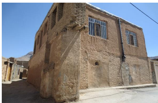
روستای هاردنگ (معماری بومی)