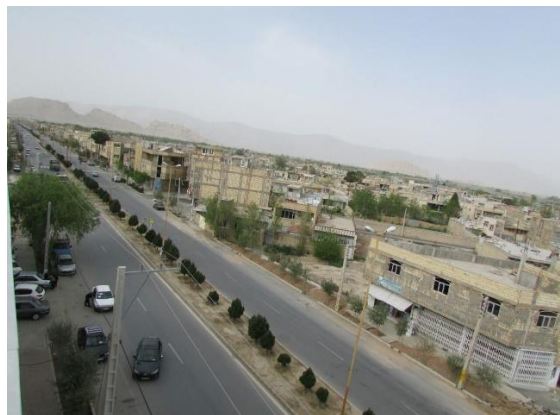
روستای فخرآباد (معماری و بافت نوین)