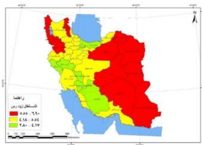
شکل - ۵: شاخص اشتغال زودرس استان‌های ایران

براساس شکل ۴ به‌مثابه ترکیبی از سه شاخص اصلی پژوهش، شاخص توسعه انسانی به‌طور عمده در استان‌های میانی - شمالی و جنوب غربی ایران در سطح بالا، در استان‌های شمال غربی، جنوب شرقی و شمال شرقی در حد متوسط و در سیستان و بلوچستان در پایین‌ترین سطح بوده است.