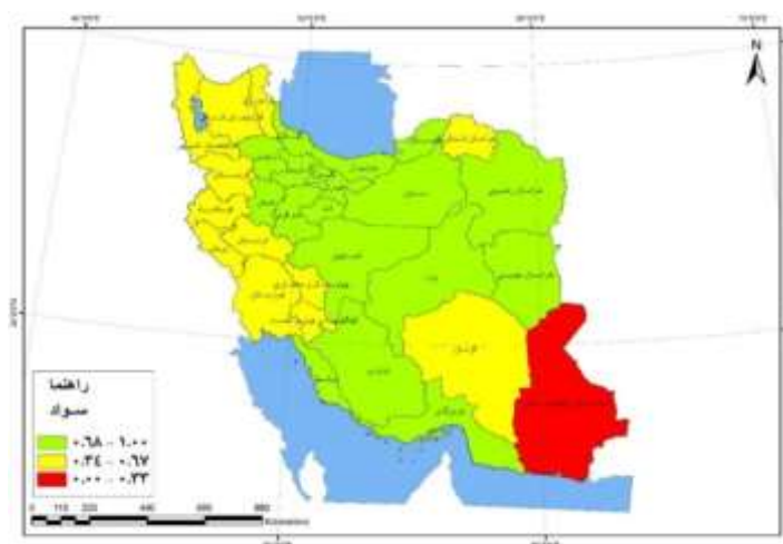
شکل - ۳: شاخص سواد استان‌های ایران

براساس شکل ۲ شاخص امید به زندگی در استان‌های البرز و تهران و بخش عمده‌ای از مناطق مرکزی، شمال و شمال غربی در سطح بالا و فقط استان سیستان و بلوچستان در پایین‌ترین سطح قرار دارد. سایر استان‌ها، بیشتر در مناطق مرزی شمال شرق، جنوب و غرب کشور در گروه متوسط هستند.