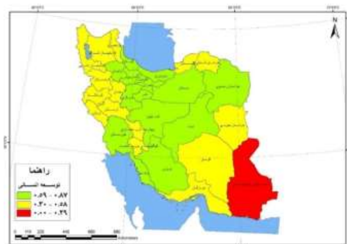
شکل - ۴: شاخص توسعه انسانی استان‌های ایران