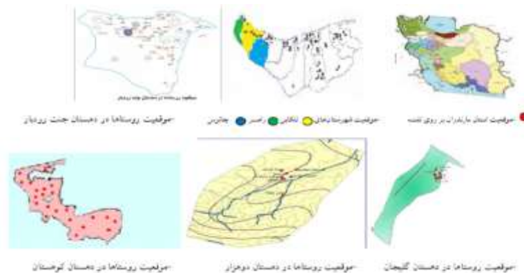
شکل ۳. موقعیت استان مازندران، شهرستان‌ها، دهستان‌ها و روستاهای آن برای انجام پژوهش

شدند. دهستان جنت رودبار در جنوب غربی شهرستان رامسر در فاصله ۶۰ کیلومتری این شهرستان قرار دارد که به «سرزمین گل‌گاوزبان» شهرت دارد. این محصول یکی از پردرآمدترین محصولات منطقه محسوب می‌شود که به سراسر کشور و کشورهای خاورمیانه صادر می‌شود. دهستان کوهستان، دهستانی از توابع بخش مرزن‌آباد شهرستان چالوس به مرکزیت تهر است. روستاهای این دهستان به دلیل برخورداری از شرایط اقلیمی و شگفتی‌های طبیعی به‌مثابه روستاهای اکوتوریسم مطرح هستند که گونه‌های متعدد گیاهی و انواع محصولات دامی دارند. در این دهستان بیشتر جمعیت به فعالیت‌های کشاورزی، دامداری و شیلات مشغول هستند که تمرکز عمده روی فعالیت‌های کشاورزی است. دهستان دوهزار از توابع بخش کوهستان شهرستان تنکابن است. روستاهای این دهستان از خوش آب‌وهواترین مناطق بیلاقی در استان مازندران هستند که باغداری، زراعت و دامپروری مهم‌ترین فعالیت مردم این روستاهاست. این دهستان از شمال به دهستان گلیجان و دریای خزر و از جنوب به پوشش جنگلی و ارتفاعات محدود می‌شود. دهستان گلیجان نیز دهستانی از توابع بخش مرکزی شهرستان تنکابن با ۷۱ روستاست. در این منطقه شالیزارهای برنج و باغ‌های مرکبات به‌وفور به چشم می‌خورد. پس از انتخاب این دهستان‌ها، ۵۰ درصد روستاهای آنها (۸۰ روستا) انتخاب و بررسی شد (از دهستان جنت رودبار ۱۱ روستا، از دهستان کوهستان ۲۲ روستا، از دهستان گلیجان ۳۵ روستا و از دهستان دوهزار ۱۲ روستا) (شکل ۳) و در نهایت تعداد ۶۹ دهیار در این روستاها در تکمیل پرسش‌نامه همکاری کردند.