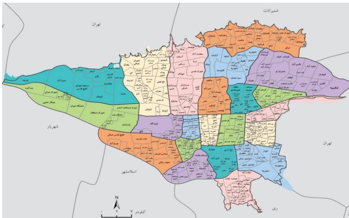
جدول ۱- تعداد پرسشنامه‌های پر شده در پیمایش به تفکیک منطقه