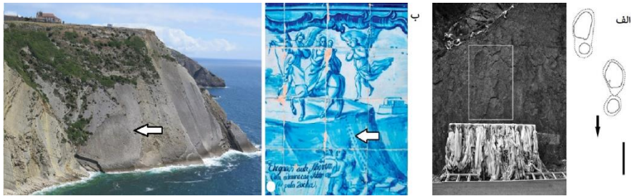
شکل ۳. فسیل ردپای دایناسورها که مقدس پنداشته شده‌اند: الف. ردپای دایناسور سورپود که در اثر فرسایش شبیه ردپای انسان شده است. پیکان جهت حرکت جانور را نشان می‌دهد و رد جلو اثر دست، رد بزرگ‌تر اثر پای دایناسور است. بوداییان تبت آن را مقدس می‌دانند و آن را جای پای خدایان یا پادشاهان اسطوره‌ای می‌پندارند (Xing et al, 2011)؛ ب. ردپای دایناسور ژوراسیک در دامنه ساحلی (پیکان) که آن را به ردپای قاطر حضرت مریم (ع) نسبت داده و در کاشی‌کاری کلیسایی در پرتغال نمایش داده‌اند (پیکان) (Lockley et al, 1994).