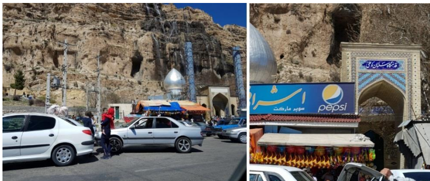
شکل ۵. نمونه‌ای از قدمگاه‌ها در ایران: قدمگاه سلمان و علی در میانه راه شیراز به کازرون که در کنار آبشار دشت ارژن بنا شده است.