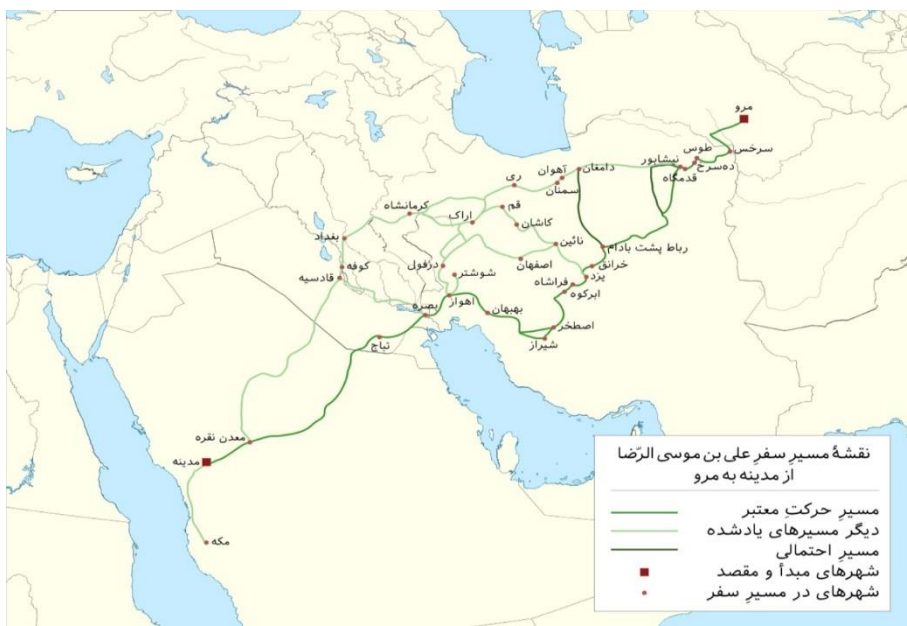
شکل ۴. مسیرهای احتمالی هجرت امام‌رضا (ع) از مدینه تا مرو (نقل از: https://fa.wikipedia.org/ ).