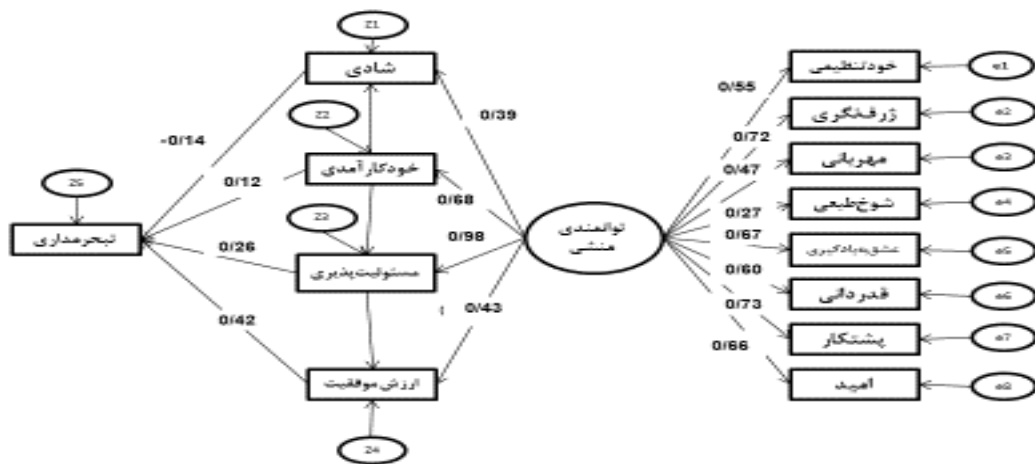
شکل ۲. مدل ساختاری توانمندی‌های منش و تبحرمداری

به‌منظور تدوین الگوی تبحرمداری مبتنی بر توانمندی‌های منش نوجوانان با متغیرهای میانجی خودکارآمدی، مسئولیت‌پذیری، ارزش موفقیت و شادی از روش مدل‌یابی معادلات ساختاری در شکل ۲ استفاده شد. در این شکل، مجموعه متغیرهای در حالت کلی (دختران و پسران) ارائه شده است. درخور ذکر