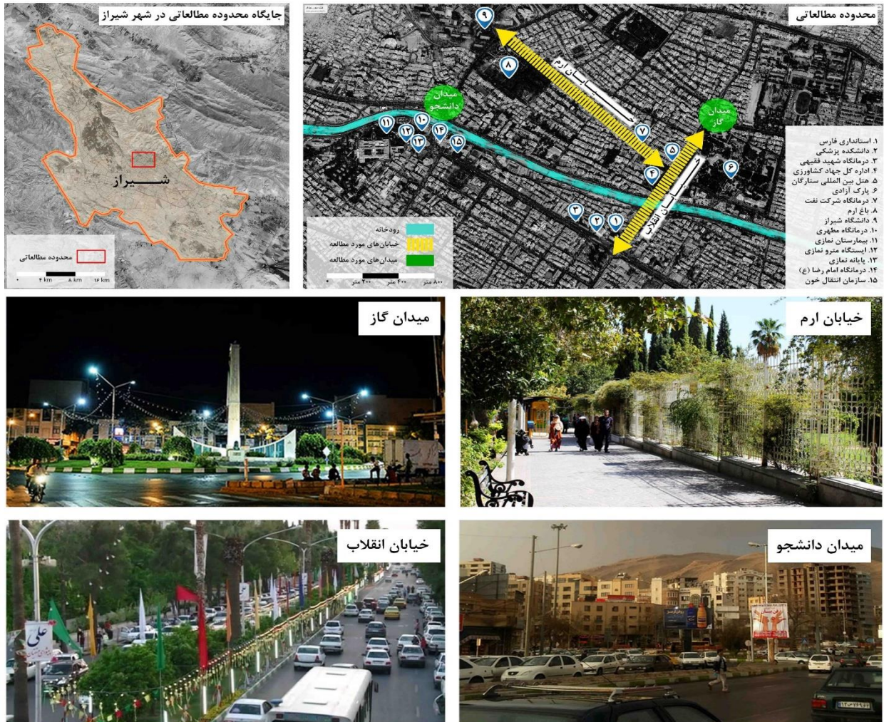
شکل ۲- موقعیت مکانی فضاهای عمومی شهری منتخب در شهر شیراز

برای بررسی رابطه احساس عدالت شهروندان شهر شیراز و کیفیت حضور آنها در فضاهای شهری پرسش‌نامه‌ای شامل دو بخش تنظیم شد: بخش اول آن شامل ویژگی‌های فردی پاسخ‌دهندگان و بررسی چگونگی حضور آنها در فضاهای شهری است و در بخش دوم از گزاره‌های مربوط به پرسش‌نامه سنجش عدالت اجتماعی راسینسکی و فلمدن استفاده شده است. بخش دوم پرسش‌نامه ۱۲ گزاره دارد (جدول ۱). به‌صورتی که پرسش‌شوندگان قادرند نظریاتشان را بر مبنای طیف لیکرت (کاملاً موافق تا کاملاً مخالف) مشخص کنند. روایی و پایایی پرسش‌نامه این پژوهش با