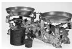
تصویر ۲: ترازو

در دنیایی که ما زندگی می‌کنیم در خرید کالاهایی چون خرما، حبوبات، سبزیجات و... از ترازو و وزنه برای اندازه‌گیری ارزش آنها استفاده می‌کنیم.