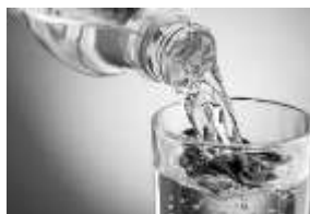
تصویر ۱: ظرف و مظروف

این مطلب که گفته شد در آخرت ظرف تابع مظروف است، بدین نکته اشاره دارد که ظرف و مظروف در جهان آخرت غیر مادی و متغیر هستند، برعکس ظرف و مظروف دنیایی که کاملاً محدود و ثابتند.