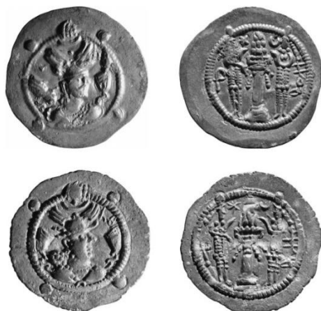
شکل ۲. دو نمونه از سکه‌های هپتالی ضرب بلخ (Heidemann, 2015).

اندیشیده بود (خواندمیر، ۱۳۸۰: ۲۴۰؛ Whithby and Whithbay, 1997: 111) از زندان گریخت، چند روزی مخفی شد و پس از آنکه از احتمال تعقیب آسوده‌خاطر شد، از مدائن خارج شد و به قصد سرزمین هپتالی‌ها راه اهواز به اصفهان را در پیش گرفت ۴۰ (دینوری، ۱۳۸۳: ۹۵). قباد و هیئت همراهش به صورت مخفیانه، شب راه می‌پیمودند و روز استراحت می‌کردند تا اینکه به سرزمین هپتالی‌ها رسیدند (نهایه‌الأرب، ۱۳۷۵: ۲۹۶). قباد نزد پادشاه هپتالی‌ها رفت و از او خواست تا لشکری همراهش کند تا تاج و تخت خویش را بازستاند (Whithby and Whithbay, 1997: 112; Cameron, 1969-1970: 129-131). شاه هپتالی خواهش قباد را پذیرفت؛ ولی با این شرط که قباد منطقه چغانیان را به وی واگذار کند (فردوسی، ۱۳۸۶: ۶۵؛ دینوری، ۱۳۸۳: ۹۵) و به پرداخت خراجی ادامه دهد که از زمان پیروز برقرار شده بود (شیپمان، ۱۳۸۶: ۵۵). پادشاه هپتالی یکی از دختران خود را به ازدواج قباد درآورد ۴۱ (Cameron, 1969-1970: 131) و قباد را به همراه سه هزار تن از هپتالی‌ها راهی مدائن کرد. آنان که خلع قباد را باعث شده بودند، نزد وی آمدند پوزش طلبیدند. قباد عذرشان را پذیرفت و جاماسپ را بخشید و در سال ۴۹۹ میلادی دوباره به تخت سلطنت نشست (دینوری، ۱۳۸۳: ۹۵).