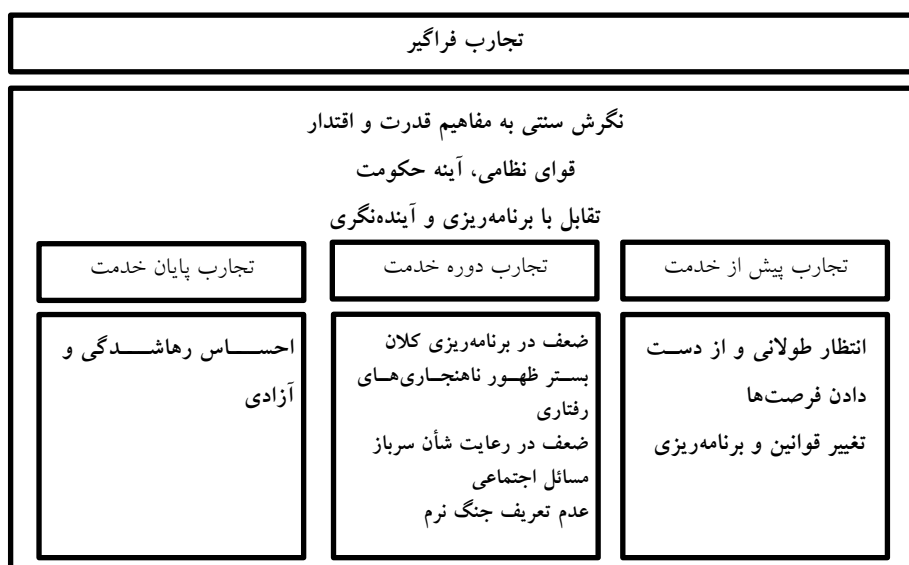
شکل ۲- درون‌مایه‌های اصلی تجارب سربازان دارای تحصیلات تکمیلی از دوره سربازی

در این پژوهش که دارای رویکرد پدیدارشناسی در تحقیقات کیفی است تجارب سربازان دارای تحصیلات تکمیلی از دوره سربازی به چهار دوره فراگیر، پیش از خدمت، خدمت و پایان خدمت تقسیم شد و در نهایت، ۱۱ درون‌مایه اصلی و ۱۶ درون‌مایه فرعی، شناخته شد.