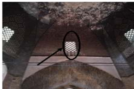
نمایی از پنجره‌ی مشبک در بازار قیصریه