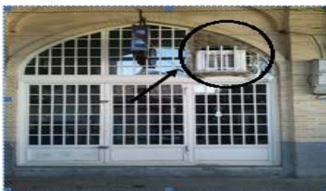
نمایی از پنجره و میستم سرمایشی در بازارچلقا