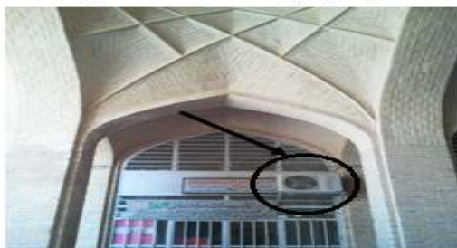
نمایی از پنجره و میستم تهویه در بازار حاج محمد علی