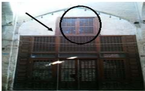
نمایی از پنجره‌ی مشبک در بازار حسن‌آباد