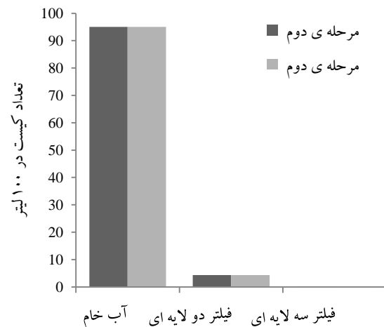
شکل ۱- نمودار تعداد کیست‌های ژیا ردیا در ۱۰۰ لیتر از نمونه

بیشتر و کدورت نمونه آب پس از فیلتر سه لایه‌ای کمتر از معمول بود. تحلیل داده‌ها در جدول ۳ در سطح ۰/۰۱ درصد خطای محاسبه شده، اختلاف معنی داری را در کدورت بین آب خام و فیلتراسیون دو لایه‌ای هم چنین آب خام و فیلتراسیون سه لایه‌ای نشان می‌دهد. در تحلیل آماری داده‌ها در سطح ۰/۰۱ درصد خطای محاسبه شده تاثیر معنی داری را بین فیلتراسیون دو لایه‌ای و سه لایه‌ای برای کدورت نمونه‌ها نشان می‌دهد.