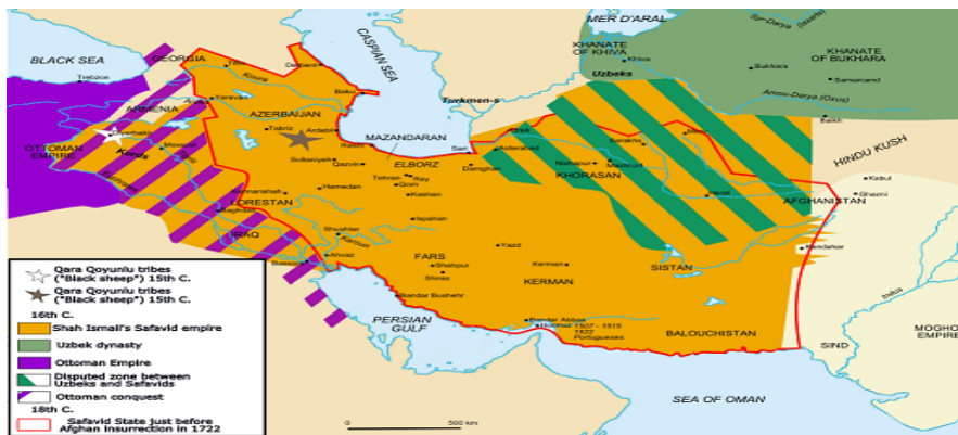
نقشه شماره (۱): سرحدات امپراتوری‌های ایران و عثمانی

اختلافات مذهبی میان ایران و عثمانی، مشکلات ایلات و عشایر مرزی و تابعیت آنها، وجود قومیت‌های گوناگون مرزنشین و از میان آنها آرامنه و مسأله سکونت شیعیان و تمرکز فرهنگی - مذهبی آنها در عتبات عالیات و مهاجرت‌ها و زیارت‌ها و سفر ساکنان پاره‌ای از مناطق ایران برای انجام مراسم حج از طریق سرزمین‌های عثمانی و همچنین، اوضاع اقتصادی و سیاسی و جز اینها، همواره ناامنی و اغتشاش‌هایی را در مناطق مرزی، به ویژه بخش‌های کردنشین و عرب‌نشین پدید می‌آورد. جنگ‌های ایران و عثمانی و به تحقیق نبردهای تاریخی ایرانیان و رومیان در گذشته‌های تاریخی در همین شرایط شکل گرفته است و به همین سبب، مرزهای ایران با کشورهای غربی خود، همواره نامشخص و در حال تغییر و دگرگونی بوده است (تکمیل همایون، ۱۳۸۰: ۶۳).