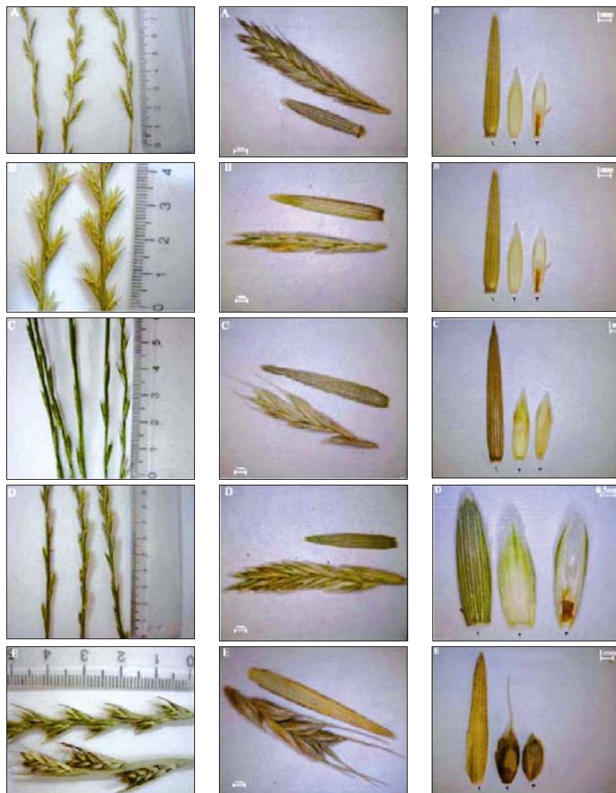
شکل ۳- تصاویر بخش‌های مختلف از ۵ گونه جنس Lolium گل‌آذین (سمت چپ)، سنبلک (وسط)، اجزای سنبلک (سمت راست، ۱- پوشه؛ ۲- پوشینه؛ ۳- پوشینک)؛ A: گونه L. multiflorum ؛ B: گونه L. rigidum ؛ C: گونه L. perenne ؛ D: گونه L. perenne و E: گونه L. temulentum .

می‌رسد L. loliaceum در سطح گونه‌ای از L. rigidum قابل تفکیک نیست و نمی‌تواند گروه مجزایی را تشکیل دهد (میرجلیلی و همکاران، ۱۳۸۰؛ Mirjalili and Bennett, 2006؛ Mirjalili et al., 2008). در این پژوهش با وجود بررسی‌های بسیاری که در محل رویش طبیعی L. loliaceum صورت پذیرفت، این گونه یافت نشد. لذا پژوهش بر روی ۵ گونه باقیمانده انجام شد. بررسی جایگاه