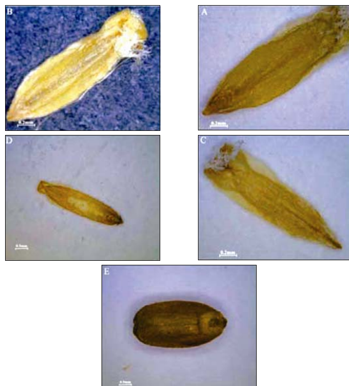
شکل ۴- تصاویری از گندمه‌های ۵ گونه جنس Lolium (A): گونه L. multiflorum ، B: گونه L. rigidum ، C: گونه L. persicum ، D: گونه L. perenne و E: گونه L. temulentum

نمودار رسته‌بندی نشان می‌دهد سه گونه دگرزادآور L. multiflorum و L. rigidum همپوشانی زیادی را با یکدیگر نشان می‌دهند و گونه L. persicum نیز در نزدیکی آنها قرار دارد. در هر دو آنالیز انجام شده، گونه L. temulentum به طور مشخص از بقیه گونه‌ها مجزاست. تقریباً مطالعات گذشته نیز در جنس Lolium ، تنوع در جایگاه گونه‌ها، به ویژه در میان گونه‌های دگرزادآور را نشان داده است. Jenkin (۱۹۵۴) با استفاده از مطالعات سیتوژنتیکی و Bennett و همکاران (۲۰۰۲) و Loos (۱۹۹۳b)، با استفاده از روش الکتروفورز دریافتند که دو گونه L. multiflorum و L. rigidum مشابهت زیادی را درون جنس نشان می‌دهند. با وجود این، Bennett (۱۹۹۷) با بررسی فنتیکی نمونه‌های