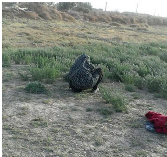
شکل ۴- نمونه‌ای از فعالیت برداشت محصول، ۱۳۹۲

است که در واقع بیانگر میزان کمک نقدی است که یک زن روستایی به خانواده‌اش می‌کند. کار پنهان زنان در سطح رفاه خانوار، چون متغیر مداخله‌گری مانند درآمد همسر وجود داشته است. برای تعدیل این مورد محققان با توجه به درآمد همسر، ابتدا خانوارهای جامعه نمونه را به چهار گروه درآمدی: