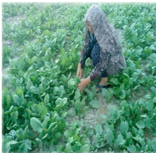
شکل ۳- نمونه‌ای از فعالیت وجین کاری، ۱۳۹۲

کشاورزی، در بذر پاشی نیز مشارکتی فعال دارند و وقت قابل توجهی (۱ ساعت و ۳۰ دقیقه در شبانه روز) را صرف این فعالیت می‌کنند. شایان ذکر است که برداشت محصول نیز به طور میانگین حدود ۲ ساعت و ۳۰ دقیقه از اوقات زنان مورد مطالعه را اشغال می‌کند. این رقم در فصول گوناگون تفاوت چشمگیری دارد و در فصول بهار و تابستان به بیشترین حد خود، حدود ۷ ساعت و ۴۰ دقیقه در شبانه روز می‌رسد؛ و در فصول پاییز و زمستان، به حدود ۵۰ دقیقه در شبانه روز کاهش می‌یابد (شکل ۴).