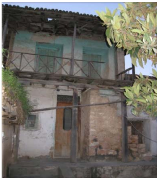
عکس شماره ۱: ساده‌ترین شکل خانه‌ها در روستا با قدمت بیش از ۱۰۰ سال

در این قسمت قدیمی‌ترین خانه‌های روستایی و یا مخروبه‌هایی از این خانه‌ها را می‌توان شاهد بود. روند شکل‌گیری بنا در روستا نشان می‌دهد که سکونتگاه‌های اولیه مردم بسیار ساده و ابتدایی بوده و هنوز هم نمونه‌هایی از آن در منطقه دیده می‌شود (عکس شماره ۱). اما در کنار این مساکن ساده با توجه به توان فرد استفاده‌کننده سکونتگاهها به اشکال پیچیده‌تری تغییر یافته‌اند. ساده‌ترین شکل خانه‌های روستایی در این منطقه قرارگیری یک یا دو اتاق در کنار هم است، اما به مرور به شکل خانه‌های سه اتاقه با طبقات مختلف و چند گانه نیز شکل گرفته است. این مساکن دارای کاربری کشاورزی، دامداری و صنایع دستی و سایر فعالیت‌هاست.