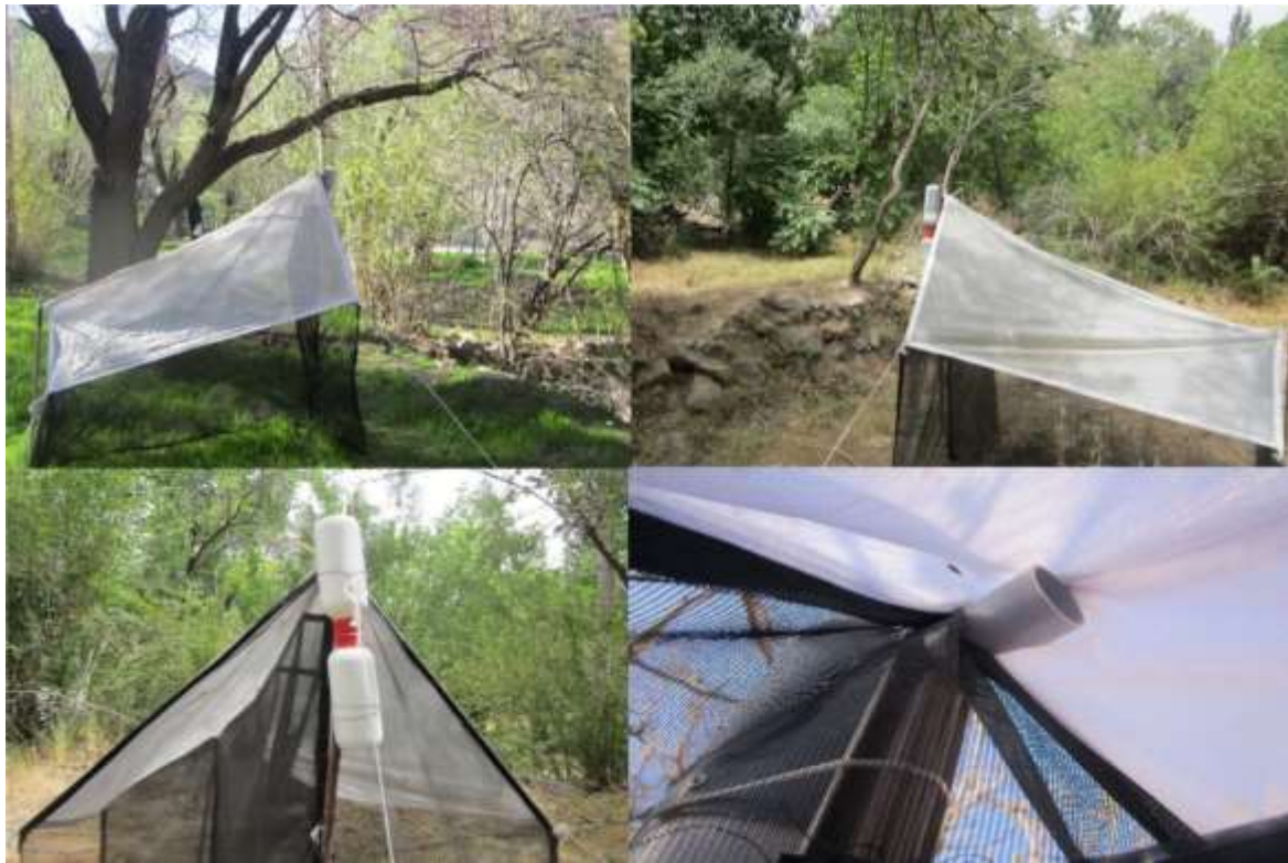
شکل ۲- تله‌های مالیز نصب شده در زیست‌بوم‌های مختلف استان یزد (اصلی)