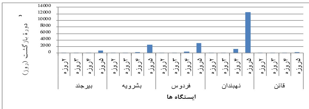
شکل ۳- دوره‌های بازگشت یخبندان‌های ۲ تا ۵ روزه ایستگاه‌های خراسان جنوبی (۲۰۱۴-۱۹۸۸)

با توجه به برآورد صورت گرفته در منطقه مطالعاتی، کمینه دوره بازگشت یخبندان دو روزه در ایستگاه قائن و سپس در ایستگاه بیرجند به ترتیب با حدود ۵/۴ و ۶/۱ روزه دیده می‌شود؛ بدین معنا که رخداد یخبندان‌های دو روزه با تکرارپذیری هر ۶ روز یک‌بار در گستره مرکزی استان انتظار می‌رود. این مقدار در گستره جنوبی و شمال غرب به ترتیب به ۱۱ و ۸ روز افزایش یافته است که گویای تکرارپذیری کمتر یخبندان‌های مداوم در این مناطق است. در مقیاس ماهیانه هم ماه‌های ژانویه (دی)، فوریه (بهمن)، نوامبر (آبان)، دسامبر (آذر) و مارس (اسفند) به ترتیب در ایستگاه‌های قائن و بیرجند، کمینه دوره بازگشت یخبندان را با تداوم دو روزه دارند. در مجموع در مقیاس‌های ماهیانه و فصلی دوره بازگشت دو روزه، کوتاه‌ترین دوره بازگشت را دارد (جدول ۴ و ۵). شکل (۳) دوره‌های بازگشت یخبندان‌های ۲ تا ۵ روزه ایستگاه‌های خراسان جنوبی را نشان می‌دهد.