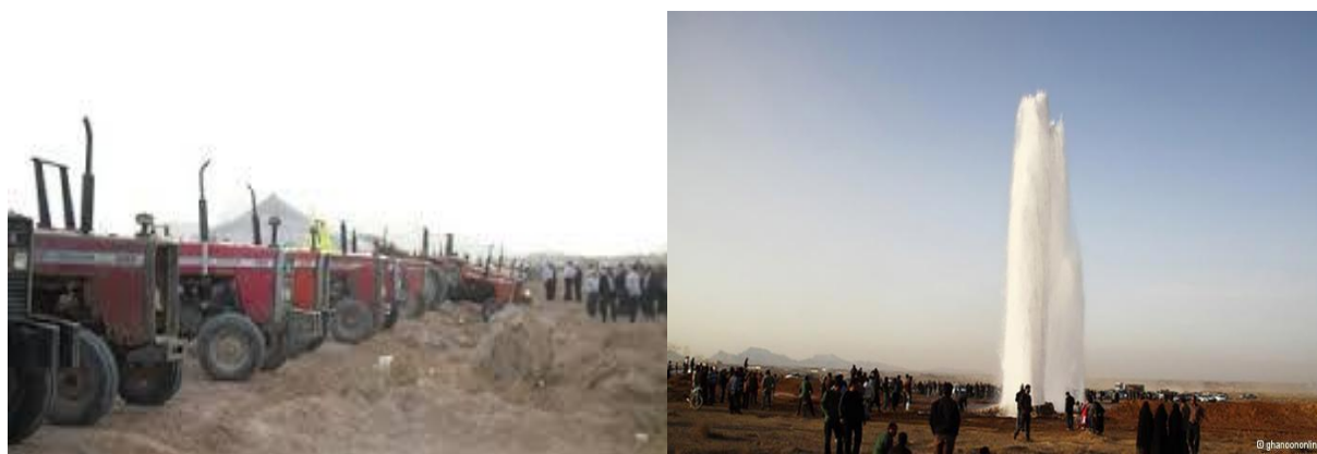
شکل ۲. اعتراض کشاورزان شرق استان اصفهان و قطع لوله انتقال آب استان یزد به‌دست کشاورزان

و مشکلات زیادی برای مردم به‌وجود آوردند که در نتیجه باعث قطعی و جیره‌بندی آب در ۱۳ شهر استان یزد شد (شکل ۲). در مقابل مسئولان یزد، استان اصفهان را با قطع سنگ آهن مجتمع ذوب آهن اصفهان تهدید کردند که از یزد تأمین می‌شود. البته پیشینه و زمینه این درگیری به شهریورماه ۱۳۹۰ برمی‌گردد که آب زاینده‌رود برای کشاورزان شرق استان اصفهان جاری شد، ولی از تیرماه ۱۳۹۱ همان‌طور که پیش‌بینی