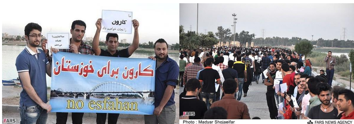
شکل ۳. اعتراض مردم استان خوزستان در انتقال آب کارون به استان اصفهان

انتقال آب این استان به اصفهان از طریق تونل بهشت‌آباد اعلام کردند (شکل ۴) (سایت خبری تحلیلی الف، ۱۳۹۳/۱/۲۸).