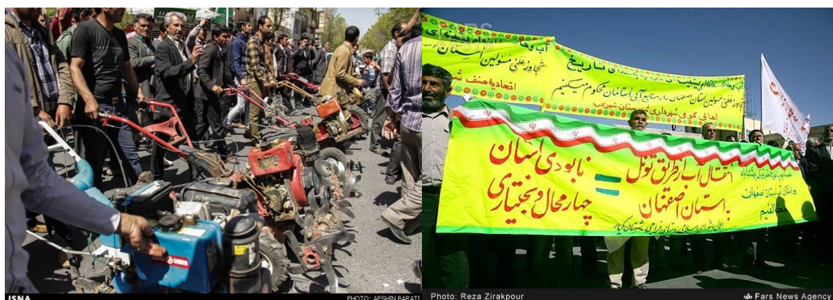
شکل ۴. اعتراض مردم چهارمحال و بختیاری در انتقال آب کارون به استان اصفهان

پس از اعتراض مردم خوزستان به انتقال آب اصفهان، مردم چهارمحال و بختیاری در ۲۸ فروردین ۱۳۹۳ با تجمع مقابل استانداری، اعتراض خود را به